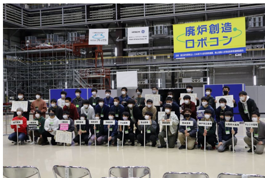
参加高専生集合写真

過去に競技に参加した学生が就職して1F 廃炉に従事するなど、人材育成・確保につながる取り組みとなっており、今後も関係機関の協力のもと継続していきたい。