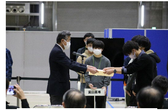
文部科学大臣賞授与 (小山工業高等専門学校)