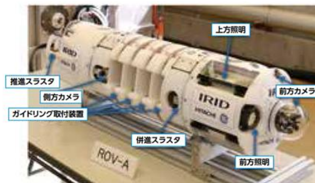
原子炉格納容器内部詳細調査用潜水機能付ボート(ROV-A)

技術研究組合 国際廃炉研究開発機構“廃炉研究開発の推移 IRID2021パンフレット”。